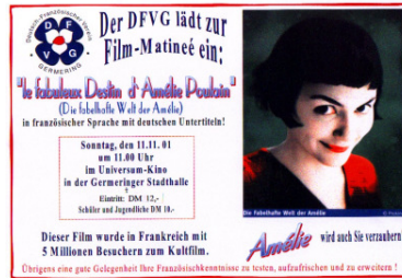
Französischer Film im Kino der Stadthalle