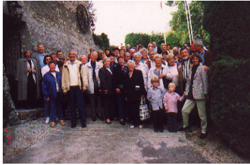
Partnerschaftsreise nach Frankreich