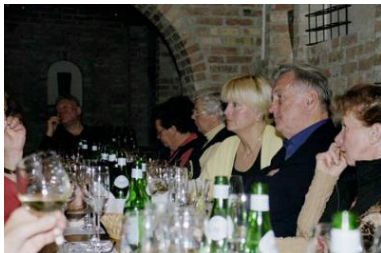
Weinprobe des DFVG