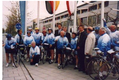
Mit dem Fahrrad von Domont nach Germering