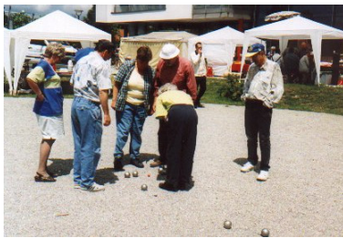
Bouleturnier mit dem 1. Germeringer Bouleclub