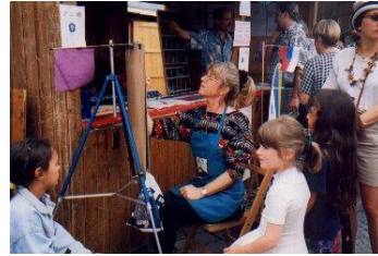
Partnerschaftsmarkt in Germering