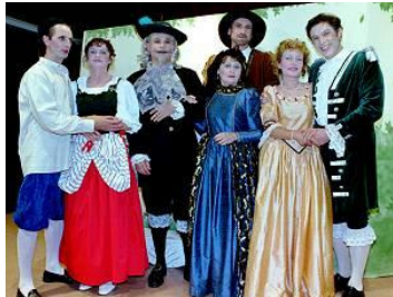
Französisches Theater mit Compagnie des Camarions