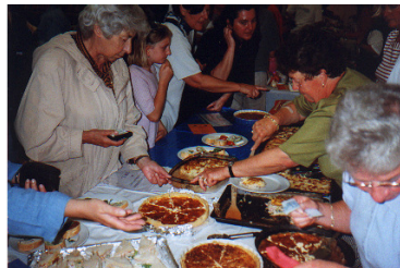
Der DFVG beim Ausländerbegegnungsabend