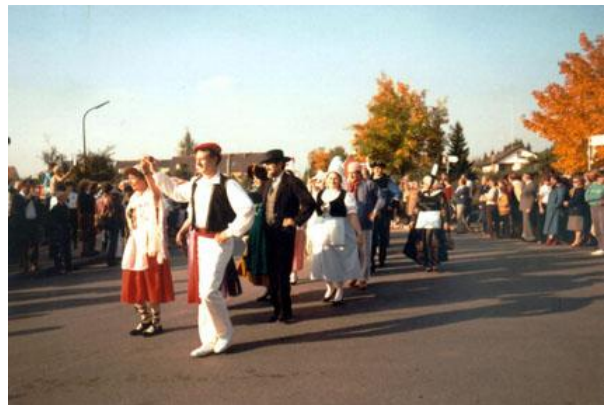
... aus Domont