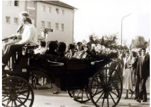
Festkutsche mit Ehrengästen