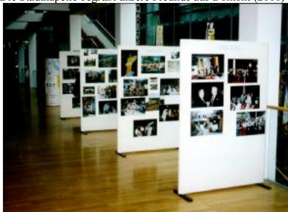
Fotoausstellung 1994, 10 Jahre Städtepartnerschaft mit Domont