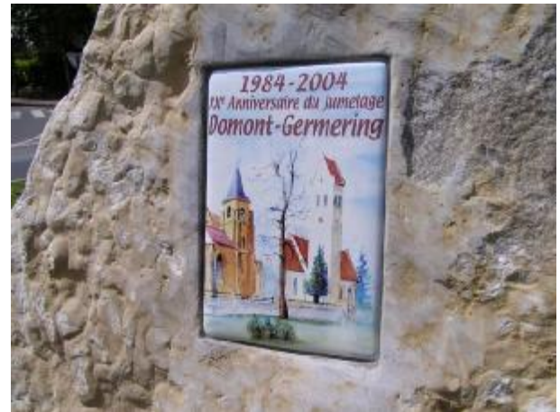
Die im Stein eingelassene Gedenktafel