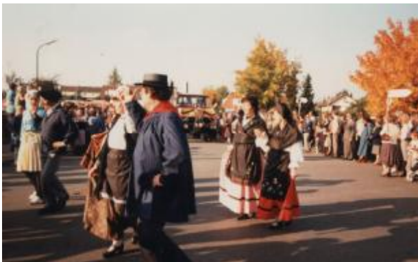
Malerische Trachten ...