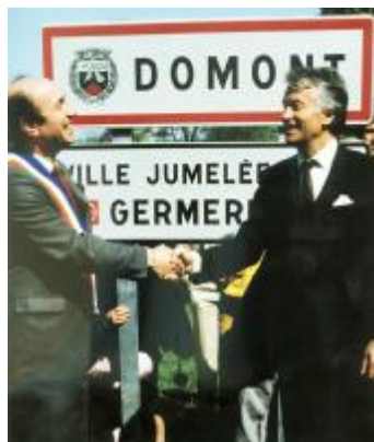
Bereits im Mai 1984 wurde in Domont die Partnerschaftstafel enthüllt