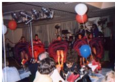
Partnerschaftsmarkt und Festball 1996: Bäckerstand mit frischen Baguettes, hergestellt beim Bäcker Bughardt vom französischen Bäcker; Auftritt einer Can Can-Gruppe beim Festball