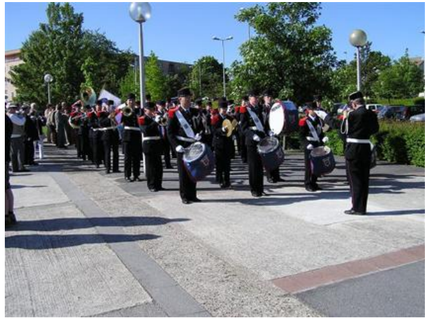
Die Domonter Feuerwehrkapelle spielt auf