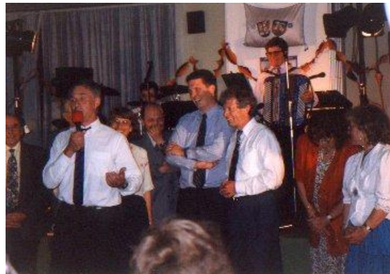
Festball 1996 anlässlich des Partnerschaftsmarktes