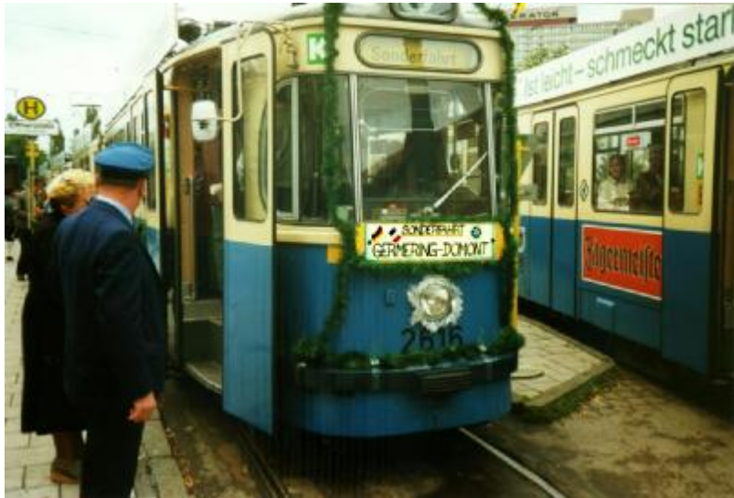
Straßenbahnfahrt durch München mit den Domontern anlässlich der 5-jährigen Städtepartnerschaft Germering-Domont am 8.10.1989