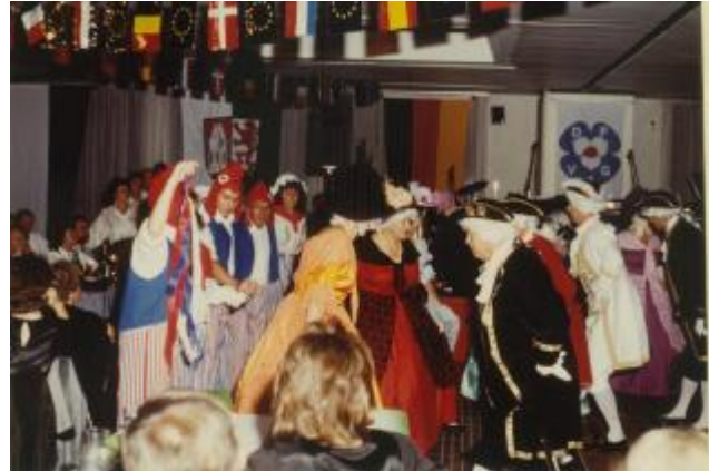
1989; Festball 5 Jahre Partnerschaft Germering / Domont