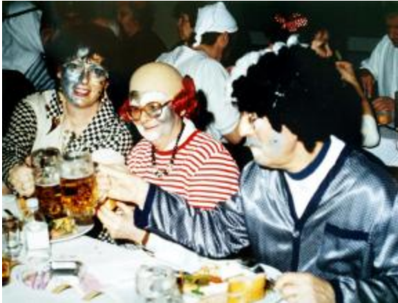
Fasching 1993 mit Freunden aus Domont

seine Französischkenntnisse zu verbessern versucht hat, wird sich gerne an diese Stunden zurückerinnern. Diese Sprachkurse machten Mut, sich auch einmal Theaterstücke in französischer Sprache zu Gemüte zu führen. Die Theatergruppe, „La Compagnie de Camafeux“ trat verschiedentlich mit Stücken von Molière und Pagnol in Germering auf.