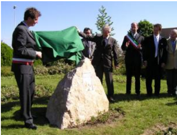
Enthüllung des Gedenksteines