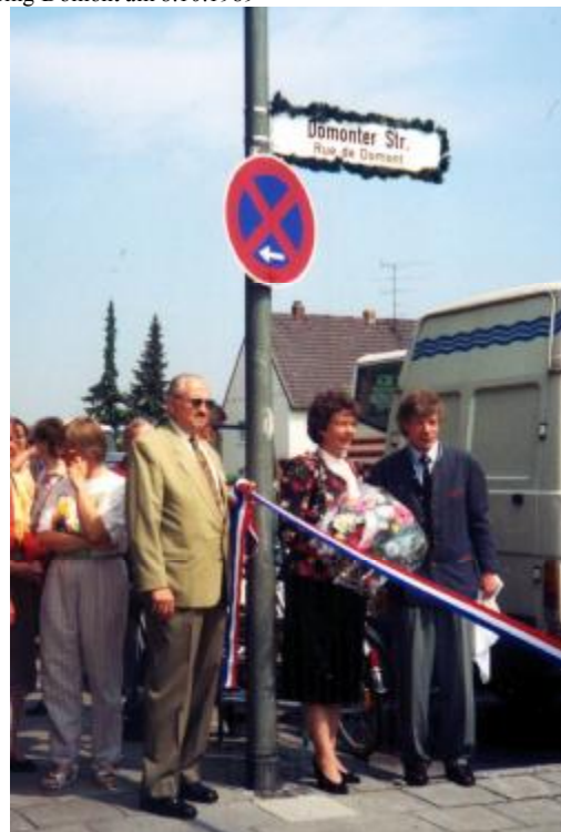
Enthüllung des Straßenschildes „Domonter Str.“ „Rue de Domont“ am 1.6.1991 anlässlich des 10-jährigen Jubiläums des DFGV