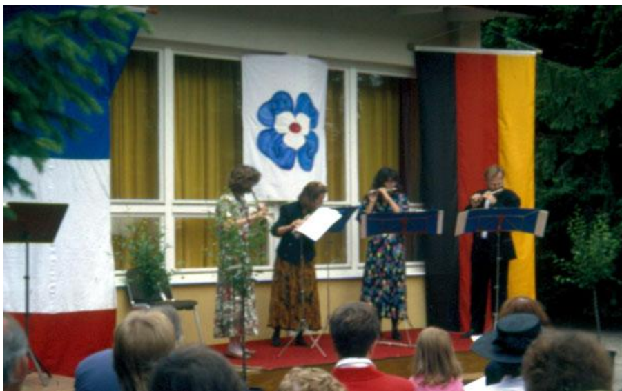
Am 18.6.1989 findet im Garten der Kleinfeldschule eine Matinée mit den Domonter Freunden anlässlich der Germeringer Kulturwochen statt.

samen Chorkonzerte oder die Chansonabende, die sinnvollerweise natürlich von französischen Künstlern gestaltet wurden. Nicht zu vergessen sind Konzerte im Park im Juni 1989 und 1991 mit über 200 Besuchern.