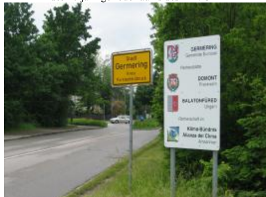
Im Juli 2004 steht das erneut erweiterte Schild an allen Ortseinfahrten.