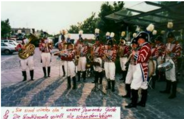
Die Stadtkapelle begrüßt unsere Freunde aus Domont (2001)