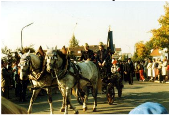
Freiwillige Feuerwehr aus Germering mit historischer Pferde-Spritze