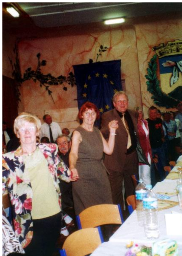
Festball in Domont