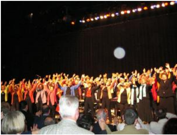
Mai 2004 in Domont; Gemeinsamer Auftritt aller Chöre