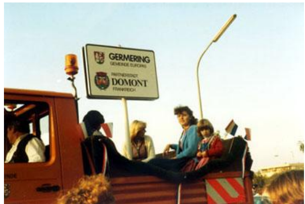
Partnerschaftsschild auf dem Weg zu seinem Platz vor dem Rathaus